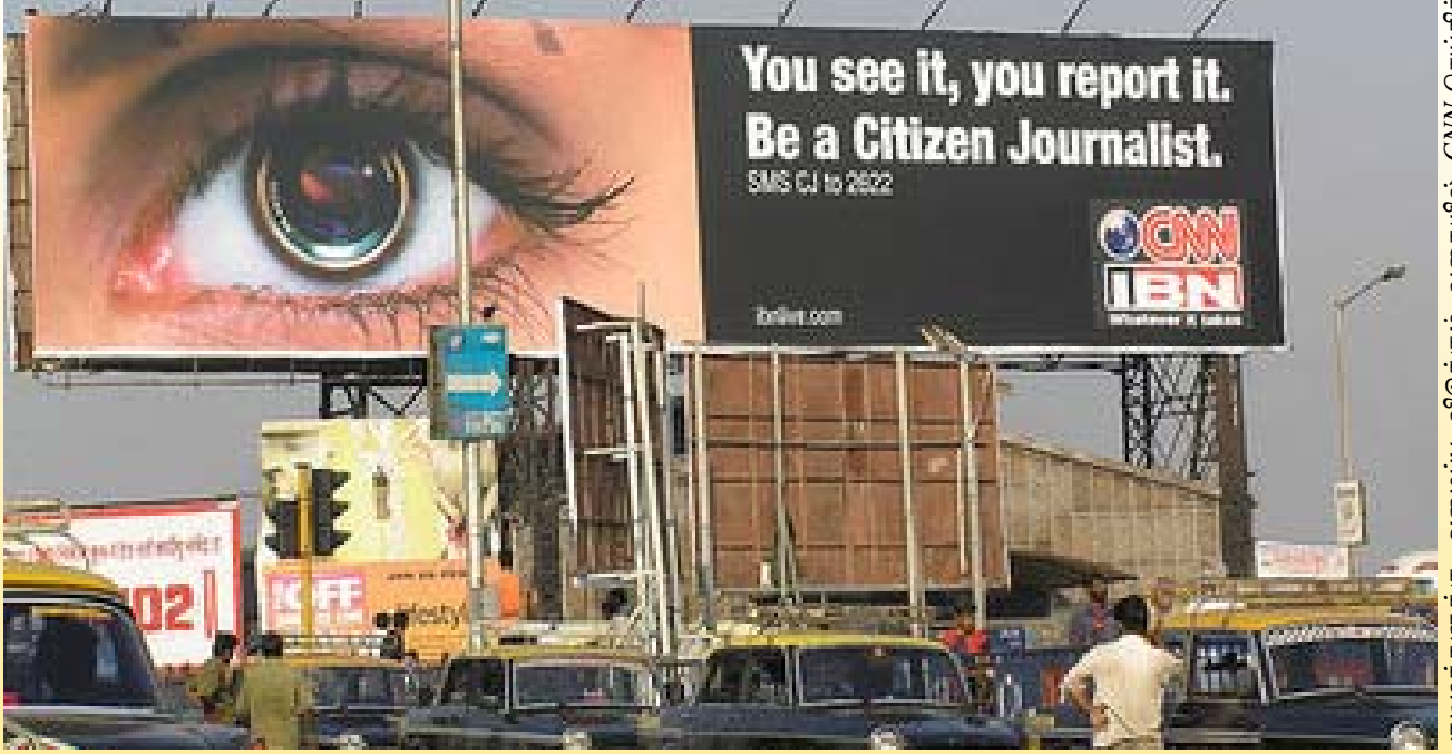
குடிமக்களுக்கு அழைப்பு விடுக்கும் வகையில் CNN செய்திச் சேவை வெளியிட்ட அறிவித்தல்.

தொழில்சார் ஊடகவியலாளர்களிடம் எதிர்பார்க்கும் ஒழுக்க நெறிக்கோவை பொறுப்புகளை குடிமக்கள் ஊடக நிருபர்களிடம் எதிர்பார்க்க முடியுமா இல்லையா என்பது குறித்து தற்போது சூடான விவாதங்கள் நடந்து கொண்டிருக்கின்றன. செய்தி மூலங்களாக அநேக வாசகர்களுடன் தொடர்பு கொள்ளக் கூடிய எந்தவொரு ஊடகமும், பிழையின்றி, பகிரங்கமாக, நேர்மையான, பக்கசார்பின்மை ஆகிய ஒழுக்கநெறிக்கோவைகளுடன் இருக்க வேண்டும். அப்படியில்லாதவிடத்து மற்றவர்களை பாதிக்கும் வகையிலும் தமக்கு சாதகமான கருத்துக்களை நிலை நிறுத்துவதற்கும் எந்தவொருவரும் குடிமக்கள் ஊடகத்தை பயன்படுத்தும் ஆபத்து இருக்கிறதென்றும் இது தொடர்பாக முன்வைக்கப்படும் கருத்துகளாகும். இதேபோல் வானம் இடிந்து விழுகிறதென்று ஓடும் முயல்களைப் போல் குடிமக்கள் நிருபர்கள் செயற்பட்டால் நிலைமை மோசமாகும். இதன்படி எந்தவொரு தொழில்சார் தராதரமும் குடிமக்கள் ஊடகத்துக்கு தேவையென்ற கருத்து இப்போது வெளிப்படுகின்றது. உலகில் மிகவும் அழுத்தம் கொடுக்கக் கூடிய குடிமக்கள் ஊடக இணையதளமான oh my news நிருபர்கள் பின்பற்றக் கூடிய ஒழுக்கநெறிக்கோவையொன்றை தயாரித்திருப்பது இதற்காகத்தான்.