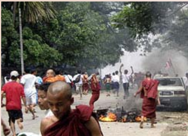
උද්ඝෝෂකයන්ට හමුදා ප්‍රහාර