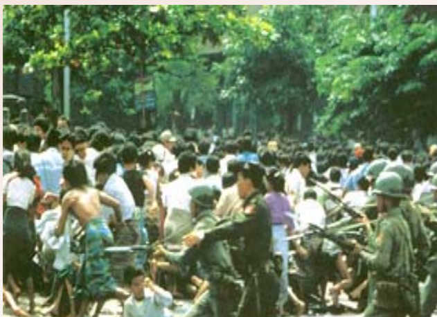
හමුදා පෙළපාලි කරුවන්ට පහර දෙමින්