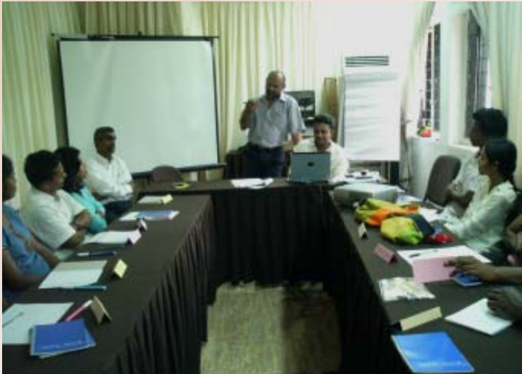
කොළඹ වැඩමුළුව පැවැත්වෙන අතරතුරදී

පුරවැසි ජනමාධ්‍ය භාවිතය ලංකාව තුළ ජනප්‍රිය කරවීමේ අරමුණ ඇතුළු රටේ විවිධ ප්‍රදේශවල පැවැත්වෙන එක්දින වැඩමුළු මාලාවේ තෙවන, සිවුවන සහ පස්වන වැඩමුළු පිළිවෙළින් ඔක්තෝබර් 16, 18 සහ 20 යන දිනවලදී බදුල්ල, කොළඹ සහ කුරුණෑගලදී පවැත්විණි. ඒ වැඩමුළුවලදී සහභාගි වූවන් විසින් ලියන ලද පුරවැසි කතා කිහිපයක් මෙහි දැක්වෙයි.