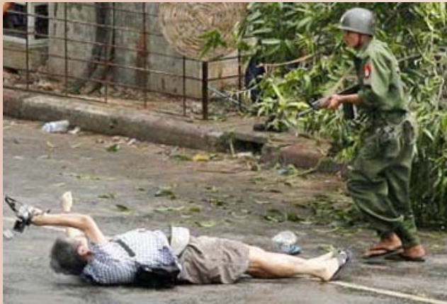
කෙන්ජ නගයී මාධ්‍යවේදියාට වෙඩි තබන අයුරු

පුරවැසි ජනමාධ්‍යයට වෘත්තීය ජනමාධ්‍යවේදියෝ සීමාවන් අහිඟවා යා හැකි බවත්, දැඩි වාරණ පනවා ඇති අවස්ථාවකදී පවා, තහංචි අතරින් රිංගා ලෝකයට සත්‍ය විදහා පෑ හැකි බවත් බුරුමයේ සිදුවීම් සමග මොනවට ඔප්පු වී ඇත. බුරුම රජය බොහෝ විදේශීය මාධ්‍යවේදීන්ට රට තුළට පැමිණීමට ඉඩ නොදී මුරකාවල් දැමීය. එහෙයින් ඒ මාධ්‍යකරුවන්ට බුරුමයේ තතු වාර්තා කරන්නට සිදු වූයේ ඉන්දියාවේ හෝ තායිලන්තයේ රැඳෙමිනි. ඔවුන්ගේත් ප්‍රධානතම ප්‍රවෘත්ති මූලාශ්‍රය බවට පත් වූයේ යැන්ගොන් (පෙරදී රැන්ගුන් ලෙස හඳුන්වන ලද බුරුම අගනුවර) හි විදි දිගේ විරෝධතා පෙළපාලිවල දහස් ගණනක් වූ උද්ඝෝෂකයන් අතර රැඳෙමින්ම පුරවැසි වාර්තාකරුවන් විසින් එවූ කෙටි පණිවුඩ sms සහ විඩියෝ දර්ශන හෝ නිශ්චල ඡායාරූපයි.